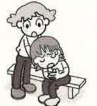
具合が悪くなったらすぐに知らせてね