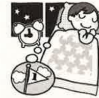
早く寝てしっかり休もう