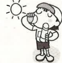
こまめに水分をとろう