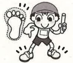
足に合った靴をはこう