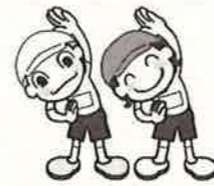
準備運動をしっかりとしよう